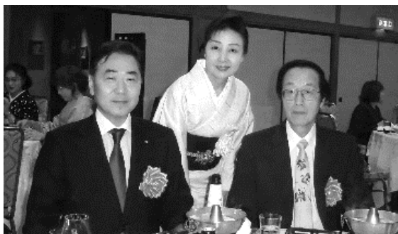
※※※※※ 県&支部の行事 ※※※※※